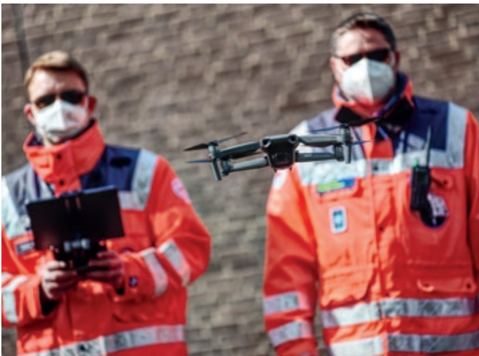
Mitarbeiter der Drohenstaffel aus dem Oberbergischen Kreis